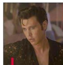
Le biopic d'Elvis est à voir au cinéma Cézanne.

Plan-de-campagne • Chemin des Pennes aux Pins : 08 92 69 66 96. Black Panther 22 h 15. Buzz l'éclair 10 h 45, 13 h 15, 15 h 35, 17 h 55 et 20 h 15. Ducobu Président! 11 h 15, 13 h 15, 15 h 20, 17 h 25, 19 h 30 et 21 h 35. Elvis 10 h 30, 13 h 10, 18 h 30 et 21 h 45. Irréductible 16 h 25 et 20 h. Joyeuse retraite 2 11 h 15, 13 h 45, 16 h, 18 h 10, 20 h 20 et 22 h 30. Jurassic World: Le Monde d'après 10 h 45, 14 h, 18 h 45 et 22 h. La Nuit du 12 10 h 30, 14 h et 19 h 30. La Petite Bande 11 h 15, 13 h 30, 15 h 45, 18 h, 20 h 15 et 22 h 30. La Traversée 16 h 45 et 22 h. Les Minions 2: Il était une fois Gru 10 h 45, 11 h 30, 13 h 10, 14 h, 15 h 20, 16 h 10, 17 h 30, 18 h 15, 19 h 40, 20 h 25, 21 h 45 et 22 h 30. Ma mini-séance: Chats par-ci, chats par-là 17 h. Menteur 11 h, 13 h 10, 15 h 30, 17 h 45, 20 h et 22 h 20. Mia et moi, L'Héroïne de Centopia 11 h 30, 13 h 35, 15 h 40 et 17 h 45. The Sadness 22 h 35. Thor: Love And Thunder 10 h 30, 11 h 30, 13 h 15, 14 h 15, 16 h, 17 h, 18 h 45, 19 h 45, 21 h 30 et 22 h 25; en 3D : 10 h 45, 11 h, 13 h 30, 13 h 45, 16 h 15, 16 h 30, 19 h, 19 h 15, 21 h 45 et 22 h.